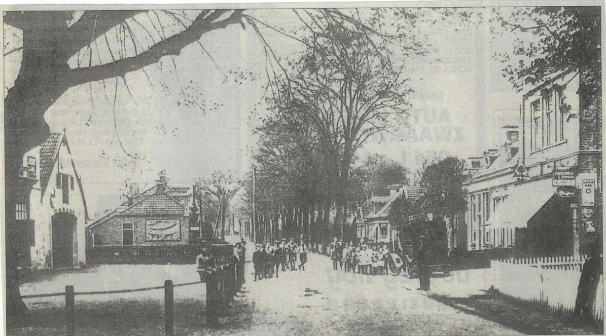
De Stationsstraat in oude tijden met aan de linkerkant een bijgebouw van 'De Roskam'.

Misschien wist u het nog niet, maar de in deze reeks verschenen publicaties zijn in druk verschenen boeken gebundeld. Tot nu toe zijn zes delen van 'Historisch Allerlei' verschenen, die voorlopig voor belangstellenden zijn verkrijgbaar zijn. Kosten 5 euro per exemplaar. De opbrengst is ten bate van de Stichting Oud-Achtcarspelen, die de historie van de eigen regio op deze manier wil promoten. Mocht u belangstelling hebben, dan kunt u bellen: 0511-541920 (Wildeboer).