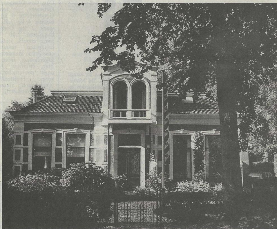
Recente opname van de voormalige dokterswoning, Stationsstraat 19, Buitenpost.